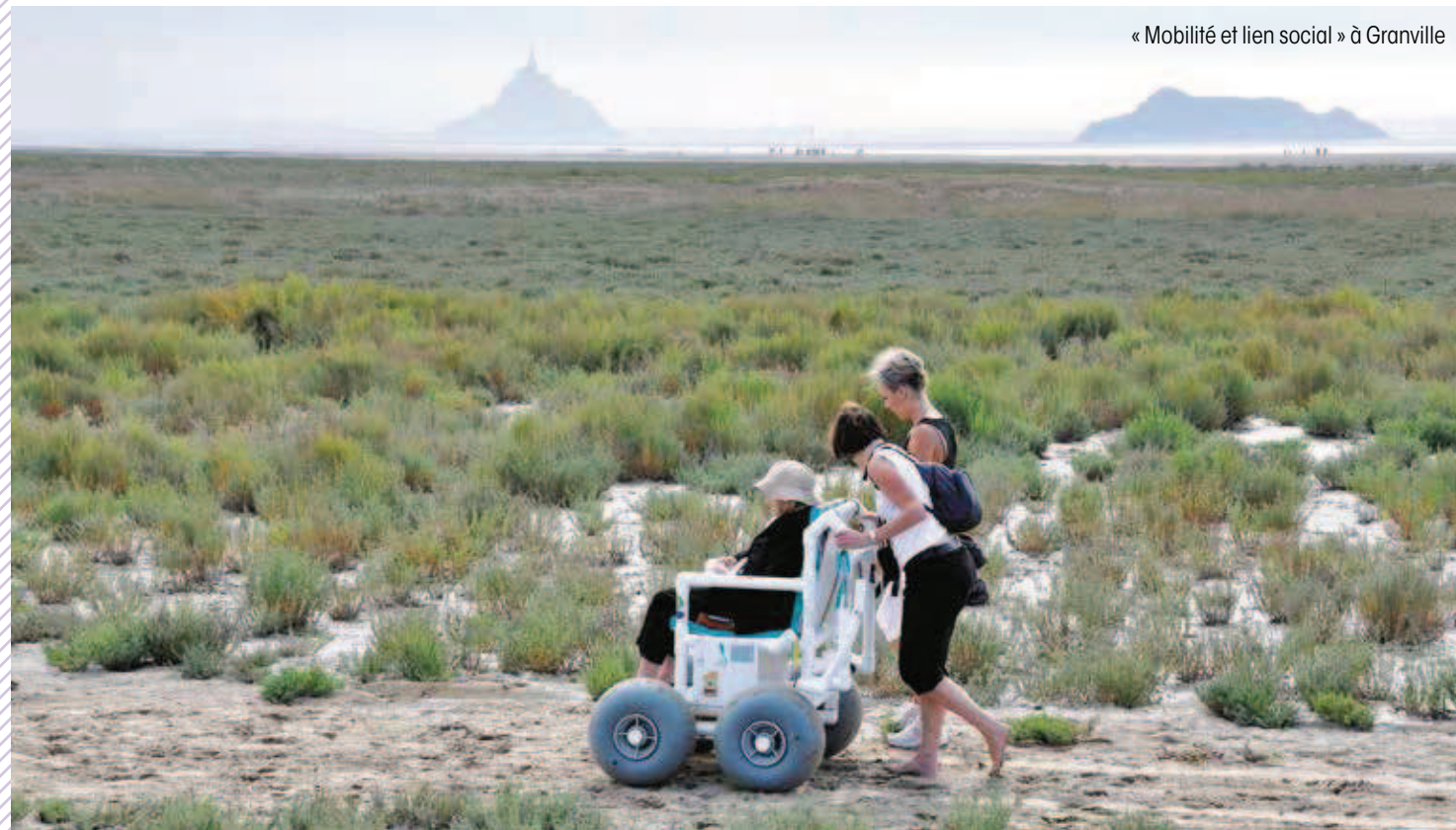
« Mobilité et lien social » à Granville