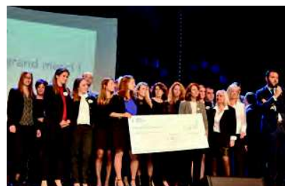
Remise de chèques à Imagine for Margo par les équipes ORPEA Côte d'Azur suite à la participation de 3 collaboratrices de la région au Raid des Alizés 2018 au profit de l'association