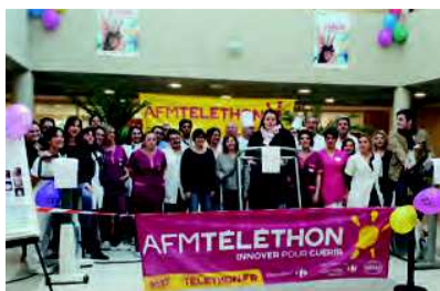
Mobilisation du Centre Cardio-Vasculaire d'Eyguières pour le Téléthon 2018